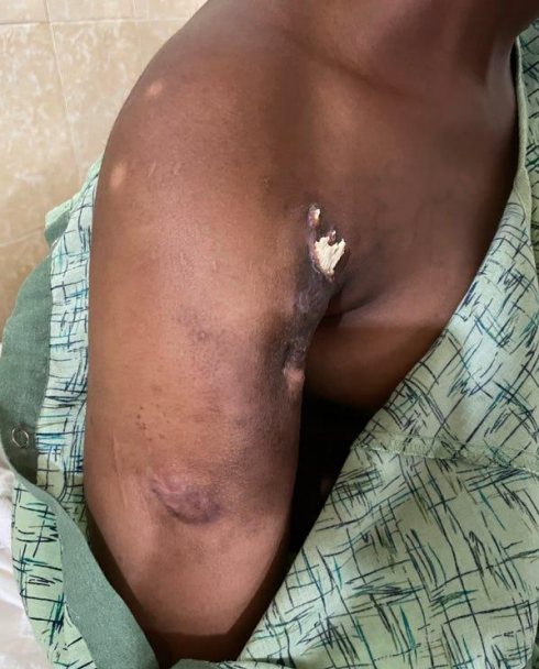
Osteomielitis Húmero fragmento óseo que sale por la piel