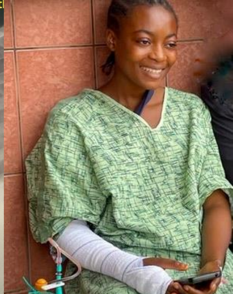
Operada y sin dolor